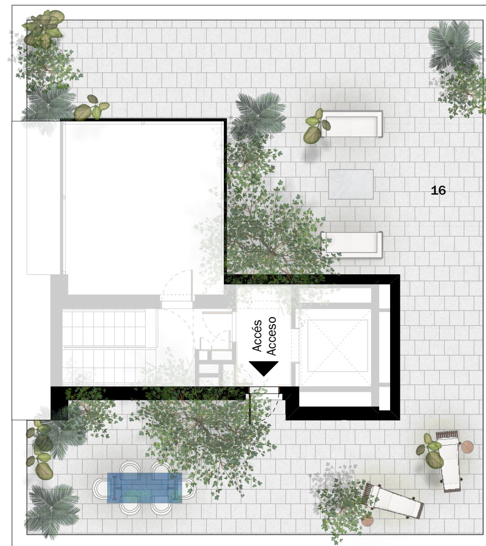
Bloc D2 Bloque D2